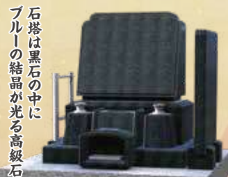
デザイン墓石 (フェリア舞台付) 間口118×奥行119×高さ152cm