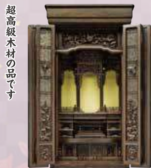
57-20 シヤム柿 総高173×幅71×奥行63cm